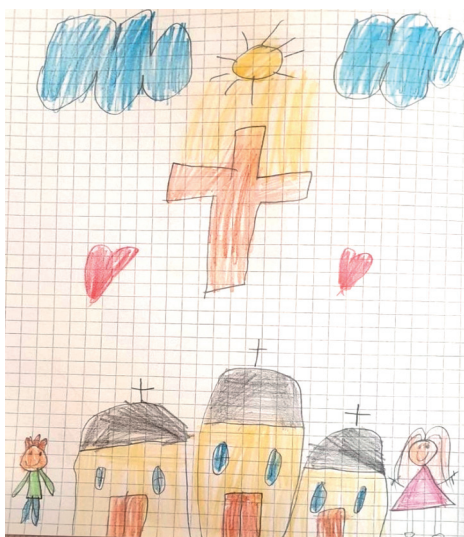
Јована Живановић 11

На почетку васкршњег поста ђак првак на часу веронауке каже: