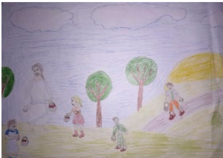
Ивана Милановић, 3.р. ИО Перушац

Ученици 2. разреда ОШ „Свети Сава“, Бајина Башта